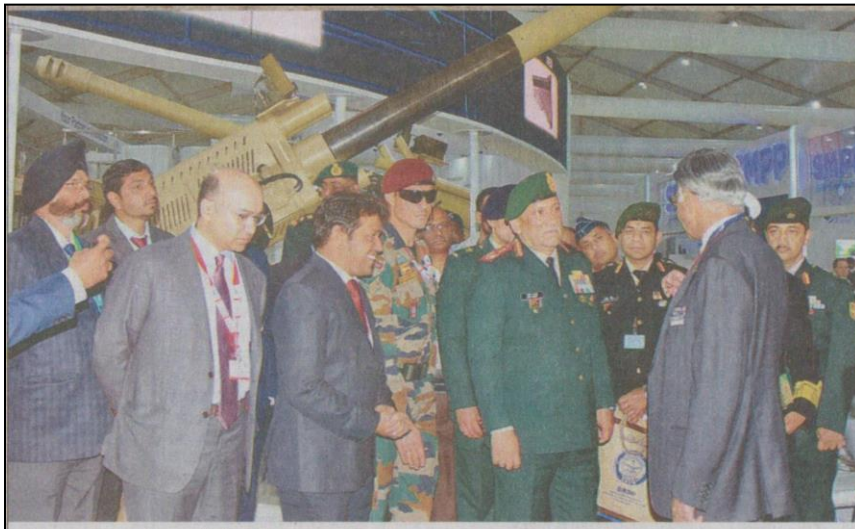
होवित्जर गन के बारे में जानकारी लेते सीडीएस जनरल बिपिन रावत