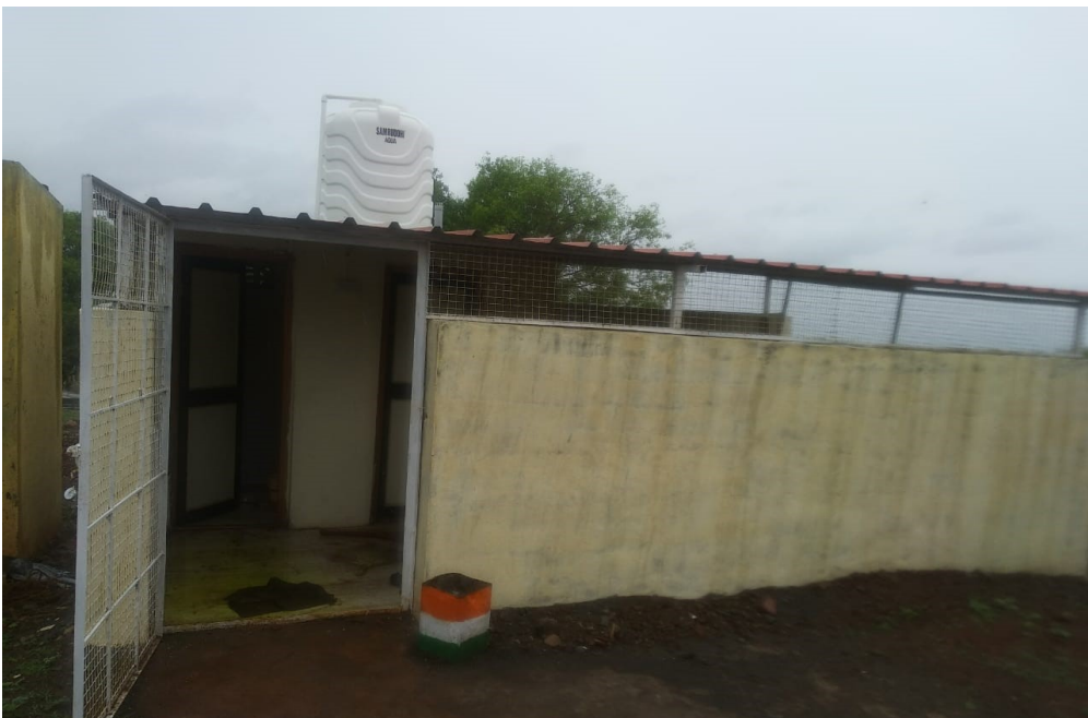
TOILET CONSTRUCTION WORK AT BOKAD DARAWADI