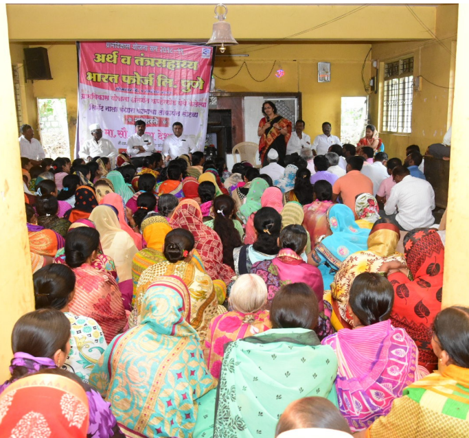
Interactions with villagers at Kanherkhed