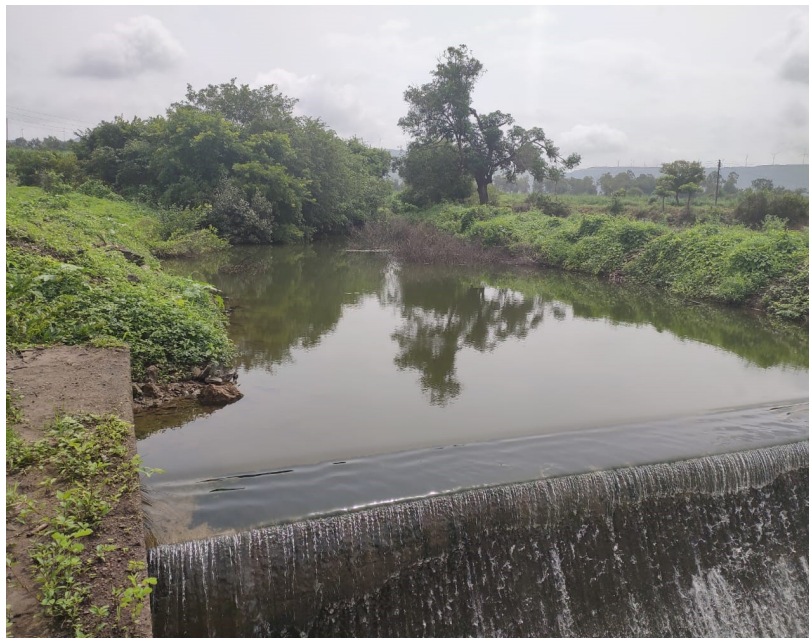
Jal Poojan at village Kanherkhed