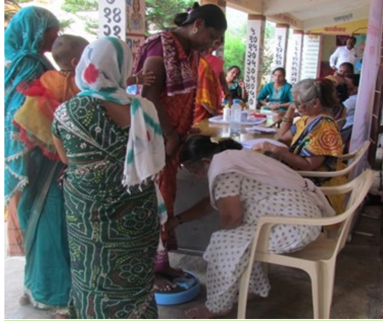
Villages Chikhali, Gangapur & Chapatewadi from Taluka Ambegaon and Village Kalewadi from Taluka Purandar