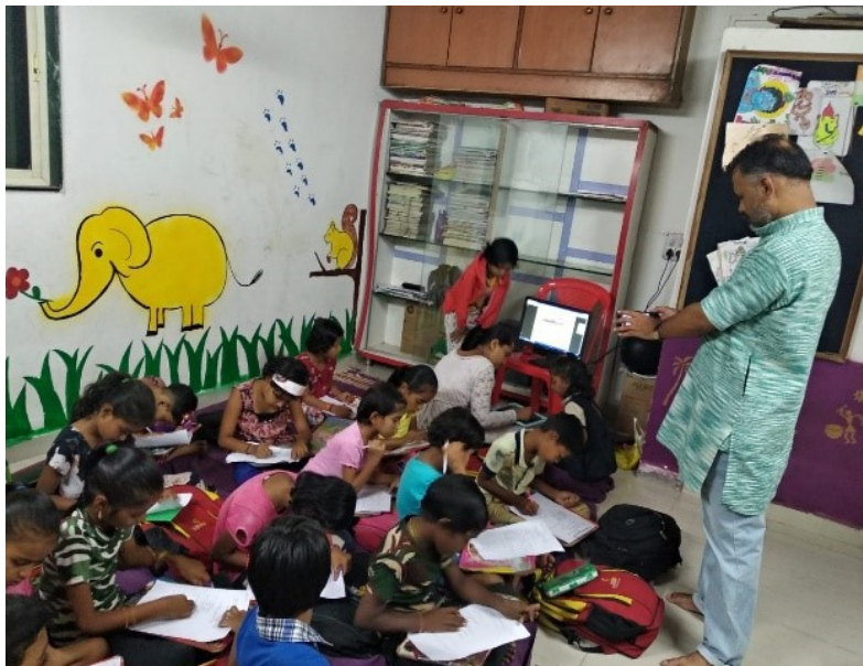
1st - Oral & Practical Evaluation of the children from Anubhav Shala