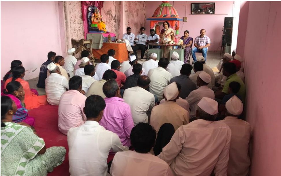
Interaction with villagers at Udachiwadi