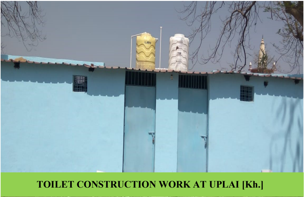
TOILET CONSTRUCTION WORK AT UPLAI [Kh.]