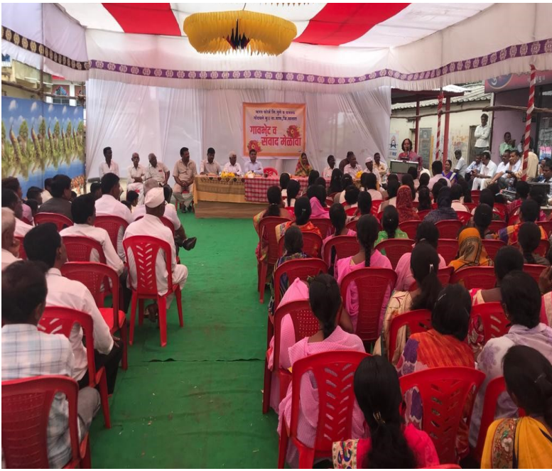
Interaction with villagers at all villages