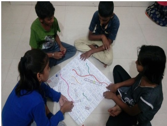
Activates based on Creativity