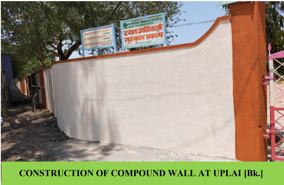
CONSTRUCTION OF COMPOUND WALL AT UPLAI [Bk.]