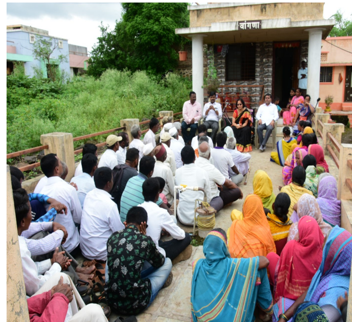
Interactions with villagers at Hivare