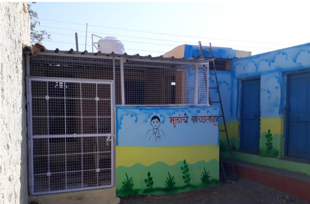
TOILET CONSTRUCTION WORK AT VADACHIWADI