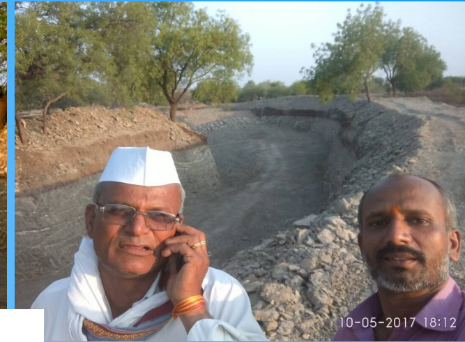
Jalyukta Shivar Work Completed at Balamtakali