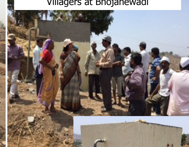
New Water Tank Work Completed