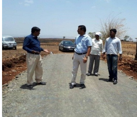
Constructed Road at Kolwadi