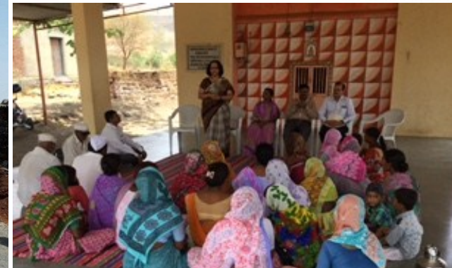
Meeting with Villagers at Kolwadi village