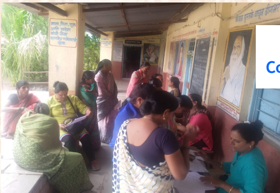
Village Pimpri - Covered 140 Women