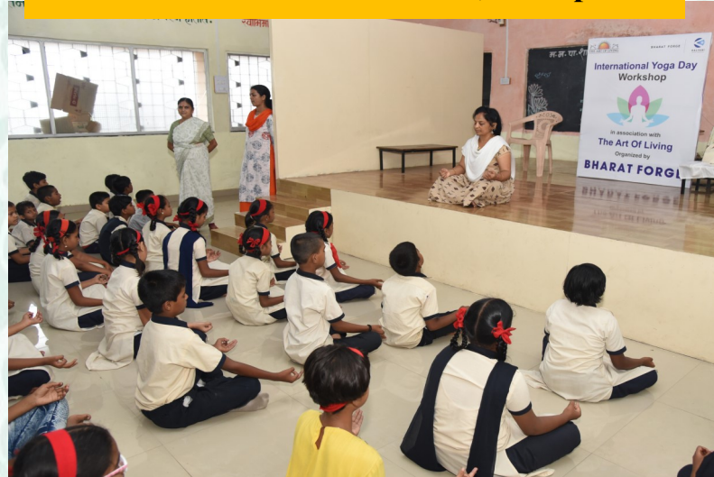
At PMC Girls School No. 87, Hadapsar