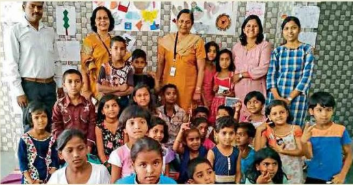
केशवनागर : भारत फोर्जतर्फे घेतलेल्या कल्पक शिबिरात सहभागी झालेले विद्यार्थी.

मुंबवा, ता. २९ : शहरातील नागरी वस्ती भागात प्रवा विकास कार्यक्रम व 'अनुभव शाळा' प्रकल्पांतर्गत भारत फोर्ज, प्रथम पुणे व ज्ञानप्रबोधिनी यांच्या संयुक्त विद्यमाने 'कल्पक व्हा' तसेच 'धमाल मस्ती उन्हाळी शिबिर' चे आयोजन करण्यात आले होते. सात दिवस चाललेल्या या शिबिरात सुमारे ३००हून अधिक विद्यार्थ्यांनी सहभाग घेतला होता. या प्रकल्पांतर्गत केशवनागर येथील गायन वस्ती व पवार वस्ती, हडपसर येथील वेताळवावा वसाहत, जनता वसाहत, पर्वती पायथा येथील विद्यार्थ्यांच्या कल्पगुणाना व कल्पकलेला वाव मिळवा, यासाठी 'धमाल मस्ती उन्हाळी शिबिर' तसेच 'कल्पक व्हा' अभियान राबविण्यात