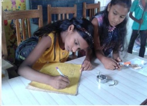
वारीसाठी स्वच्छतेचा संदेश देणारे फलक