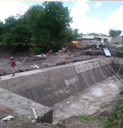
Construction of Cement Nala Bandhara at Rui

Beneficiaries : 14000+ People of 7 villages