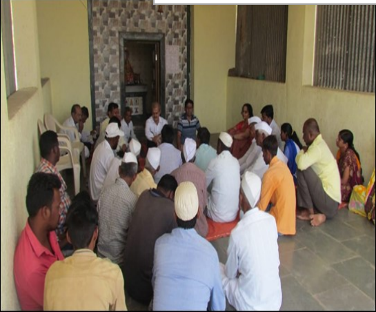
Interactions with villagers at Kothmdara, Chawand, Tejur Apti & Thakarwadi