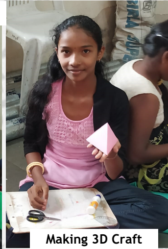
Making 3D Craft