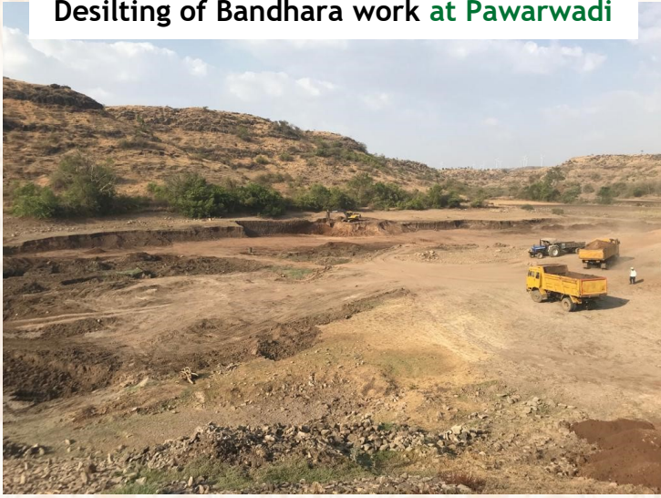
Desilting of Bandhara work at Pawarwadi