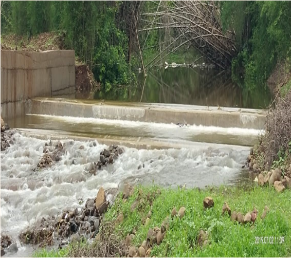
Village Devale - 1 Bandhara