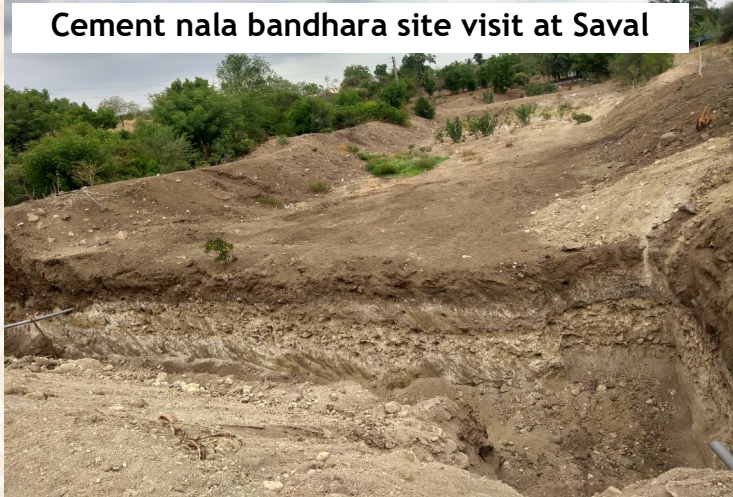
Cement nala bandhara site visit at Saval