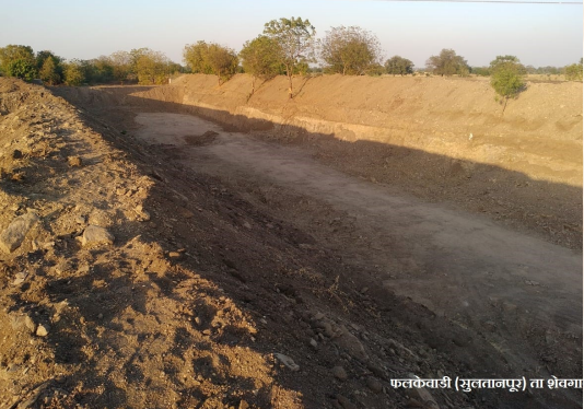
फलकैवाडी (मुलतानपूर) ता शेवगा