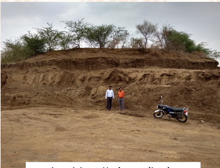
site visit at Madanwadi talav