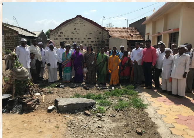
Construction of Internal Concrete Road & Road side Gutter work at Belewadi