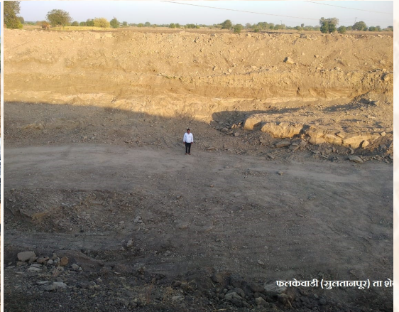
फलकैवाडी (मुलतानपूर) ता शे