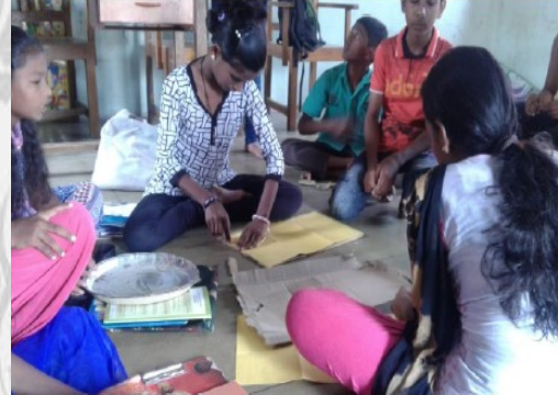
स्वच्छतेचा संदेश देणारे फलक