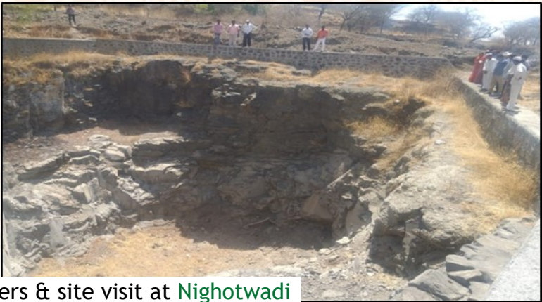
Interactions with the villagers & site visit at Nighotwadi

Visited new villages namely - Nighotwadi, Fulwade, Apati, Chawand & Tejur, [near Junnar] for need identification.