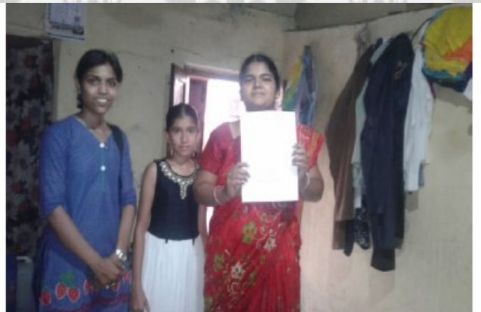
गृहभेटी देऊन मुलांना वर्गाची माहिती देताना