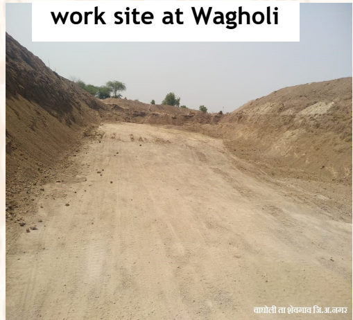
वाघोली ता शेवगाव जि.अ.नगर