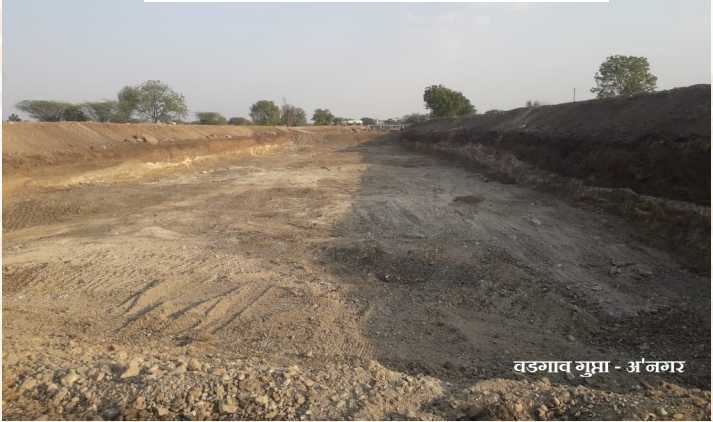
वडगाव गुप्ता - अ'नगर