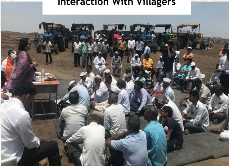
Interaction With Villagers