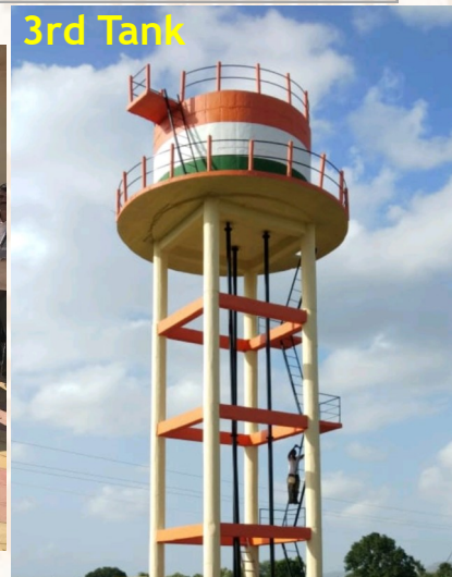
Constructed water tank at Nigadi