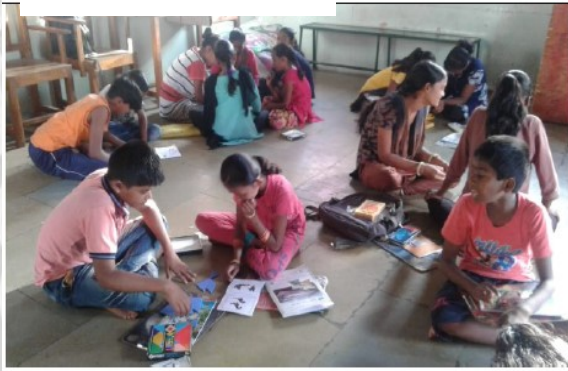
Playing Game on Creativity