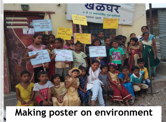
Making poster on environment