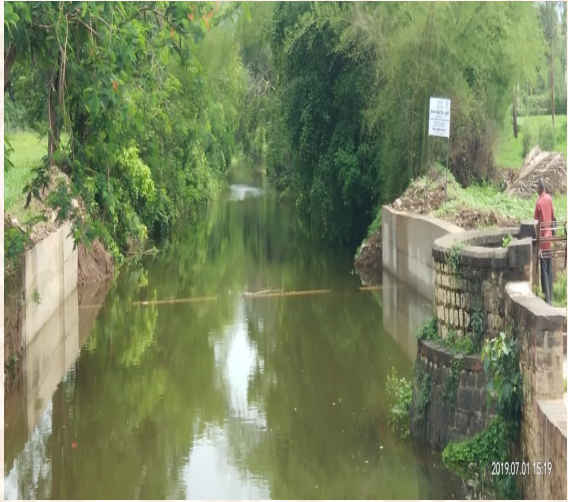
Village Awali - 2 Bandhara