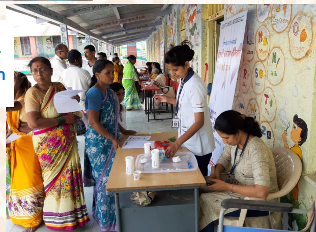
Village Pawarwadi - Covered 125 Women