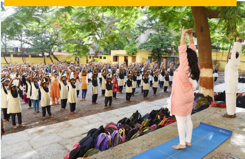
At Mahatma Phule High school, Hadapsar