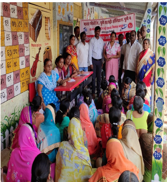
Village Rui— Covered 139 Women

Cancer Screening Camps with Hemoglobin test and awareness sessions were conducted with the support of Sahyadri Hospital, Karad and NGO - Samvedana, for 404 women from Villages - Rui, Pimpri & Pawarwadi, Taluka Koregaon, Dist. Satara on 15th, 18 th & 22 nd June 2019 respectively.